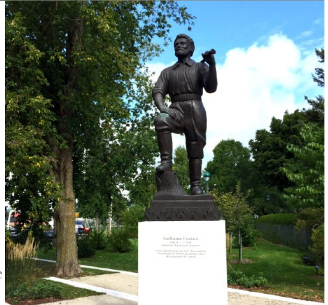
Monument de Guillaume Couture à Lévis

Acte de baptême de Guillaume Couture.