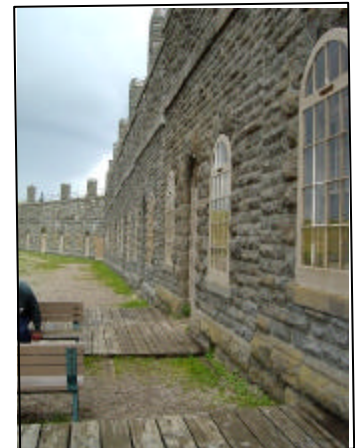
Fort No 1