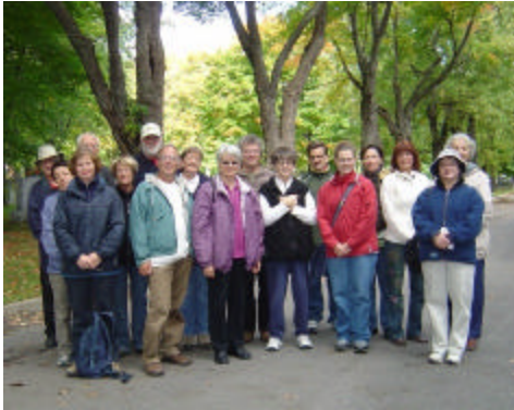
Une partie des visiteurs

Dimanche 30 septembre, à l'occasion des Journées de la culture, la Société de généalogie de Lévis, en collaboration avec la Corporation du Cimetière, offrait aux visiteurs une visite guidée du cimetière Mont-Marie.